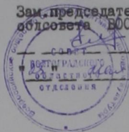
фото документов за 1972-1987 годы