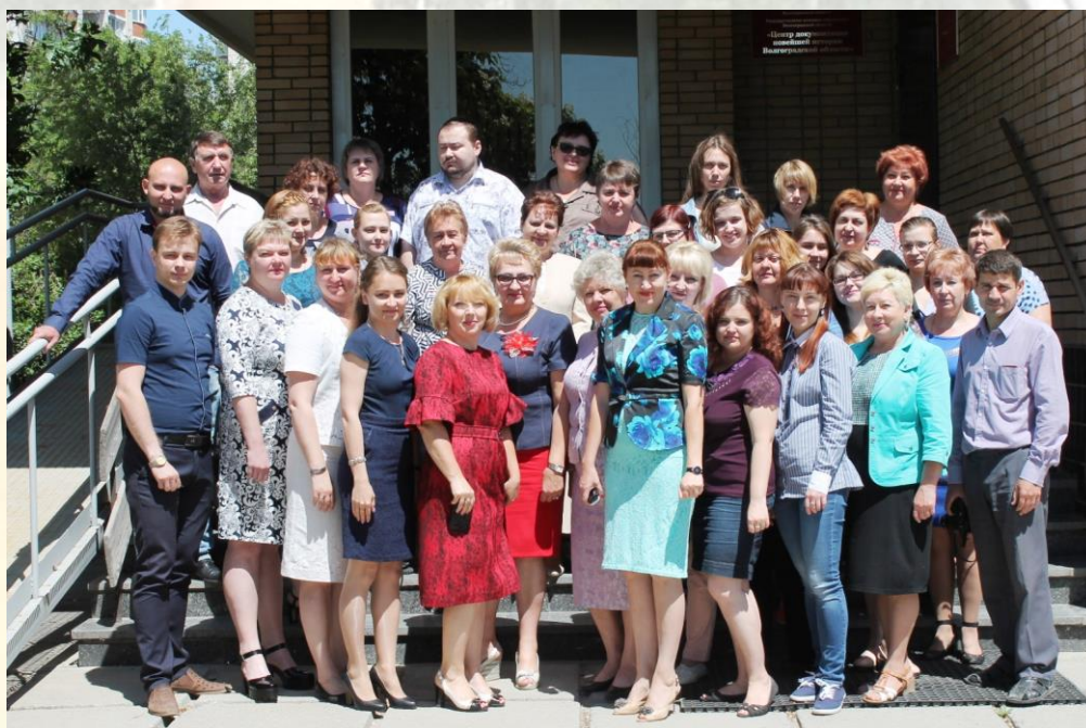
100-летие государственной архивной службы России. Коллектив ГКУВО «ЦДНИВО». 1 июня 2018 г.

В настоящее время в структуре ГКУВО «ЦДНИВО» – 7 отделов, 2 сектора, 42 работника.