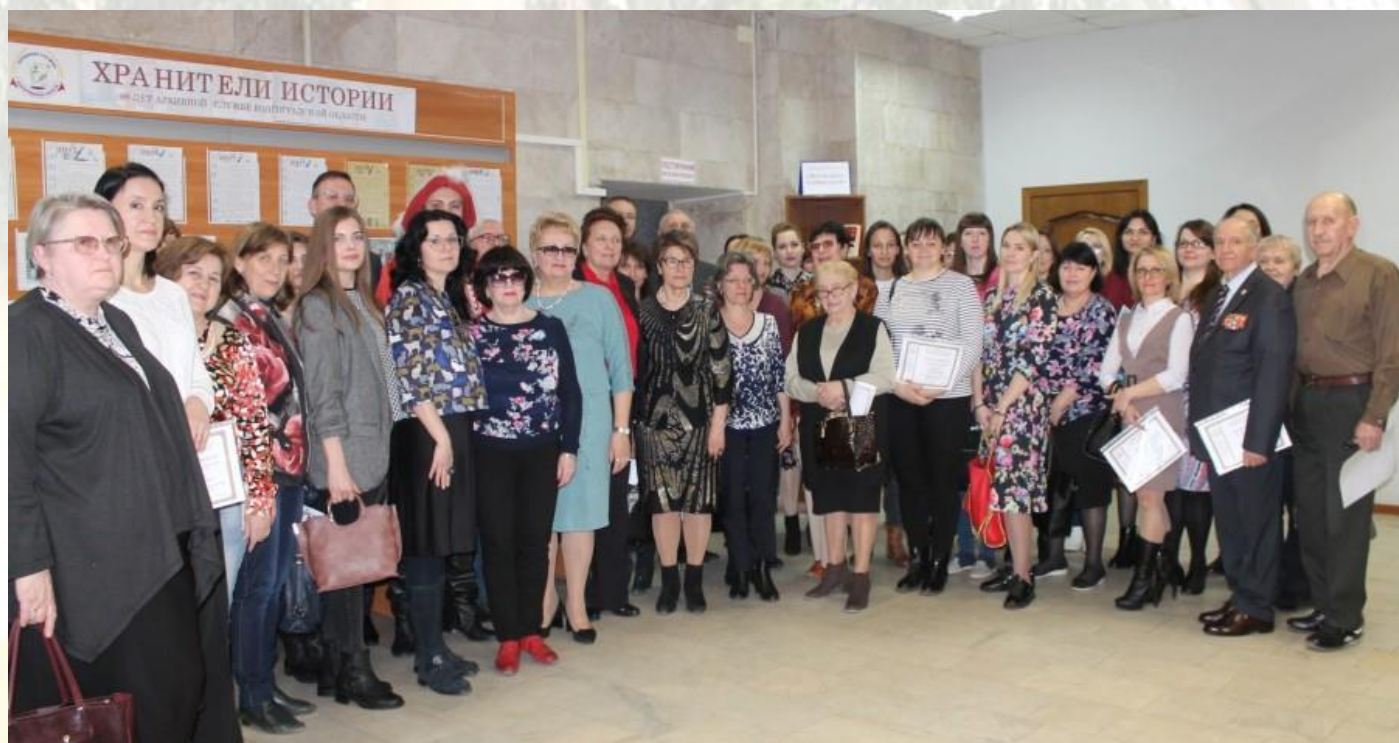
Круглый стол «Архивные учреждения – вчера, сегодня, завтра» с источниками комплектования ГКУВО «ЦДНИВО», посвященный 300-летию со дня образования архивов организаций России. 13 марта 2020 г.

На мероприятии присутствовали руководители организаций – источников комплектования ГКУВО «ЦДНИВО».