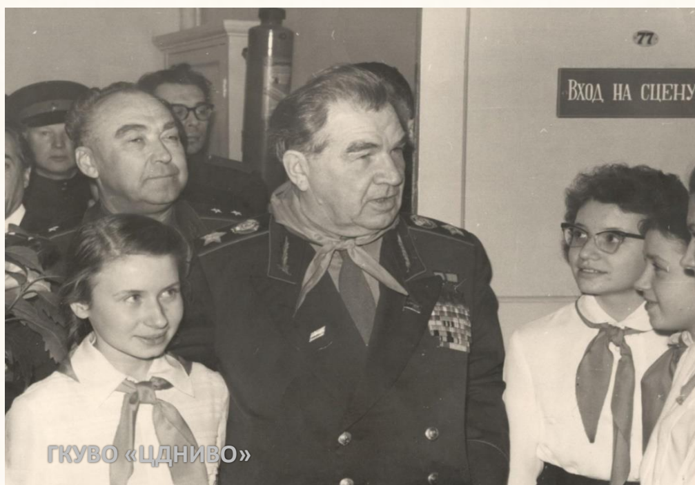
Маршал СССР В.И. Чуйков в гостях у пионеров Волгограда. Волгоград, 1965 г.