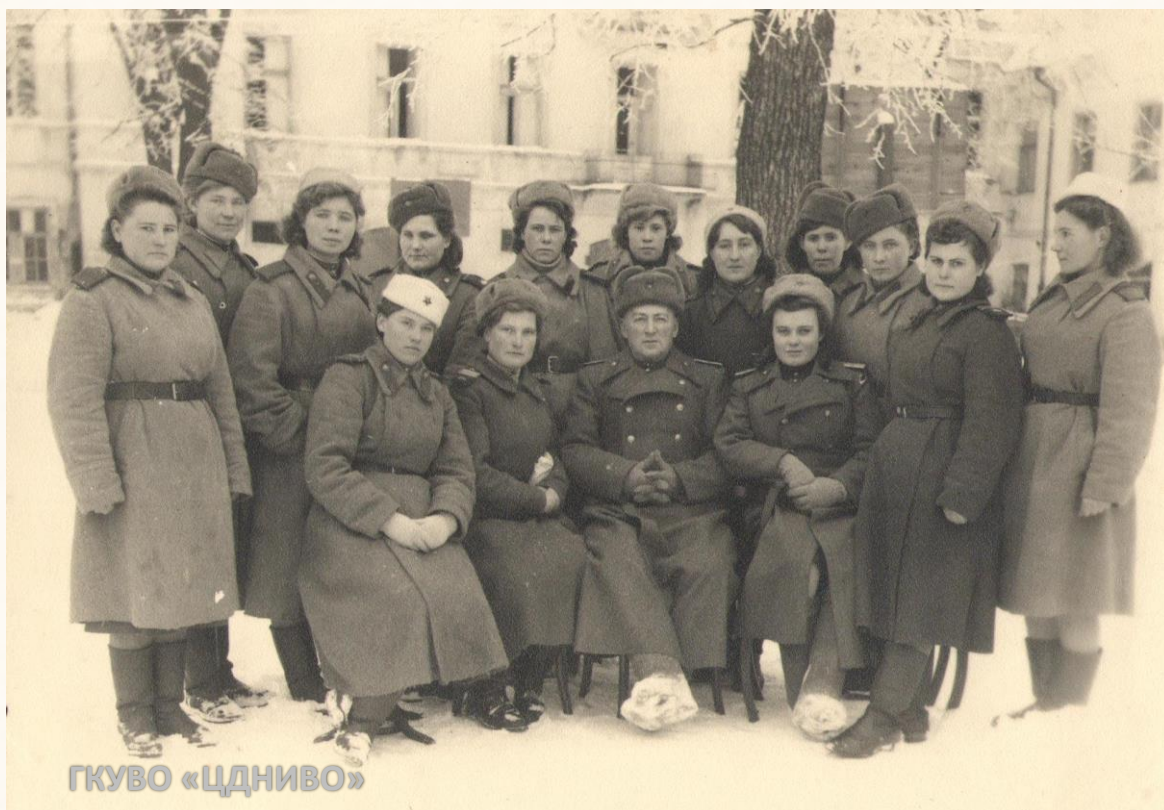
Группа санинструкторов батареи 73-го гвардейского малокалиберного зенитного артиллерийского полка (МЗАП). Сталинградский корпусной район ПВО. Южный фронт // ЦДНИВО. Ф. 13226. Оп. 3. Д. 144.