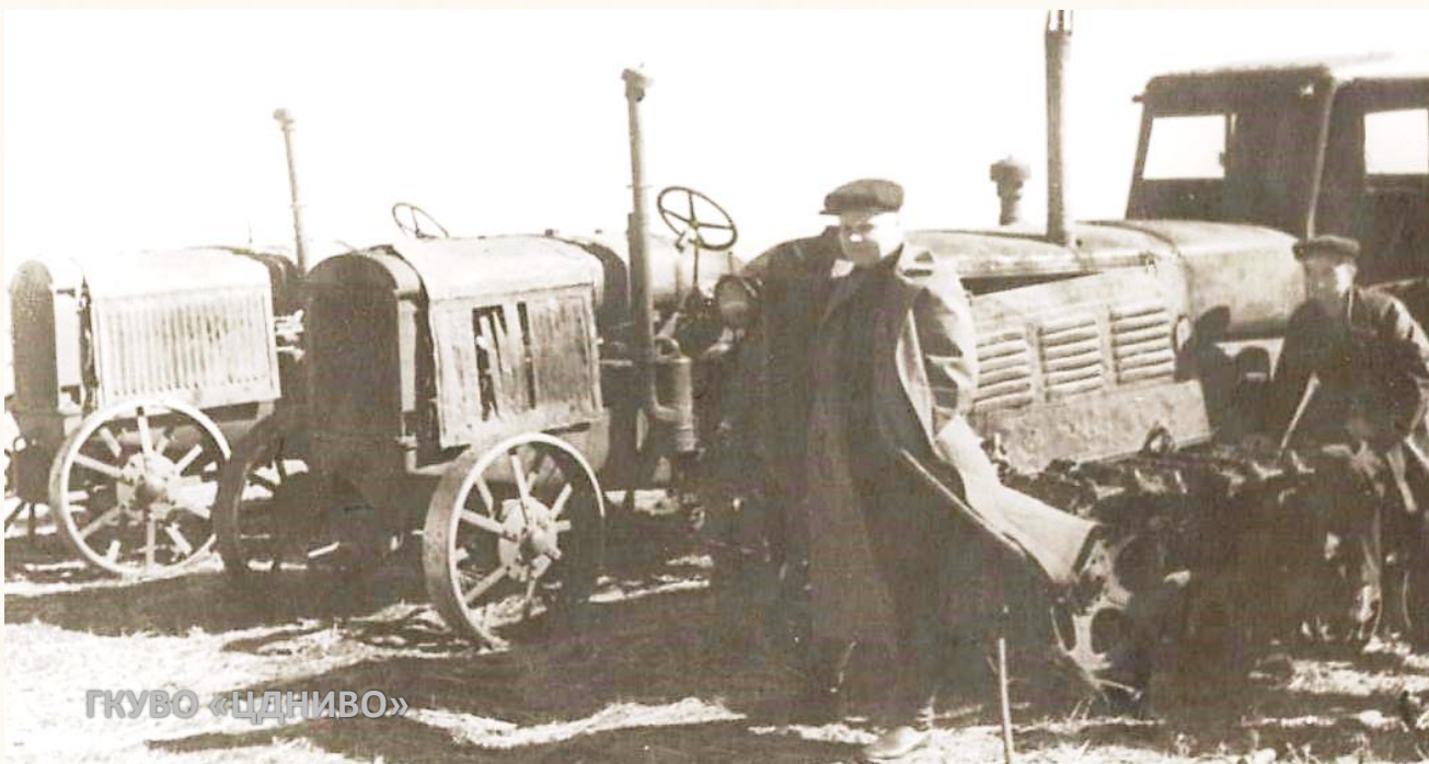
Василий Тимофеевич Прохвятилов, 2-й секретарь Сталинградского обкома ВКП(б), в Даниловском районе, 1942 г. // ЦДНИВО. Ф. 13226. Оп. 1. Д. 929. Л. 1.