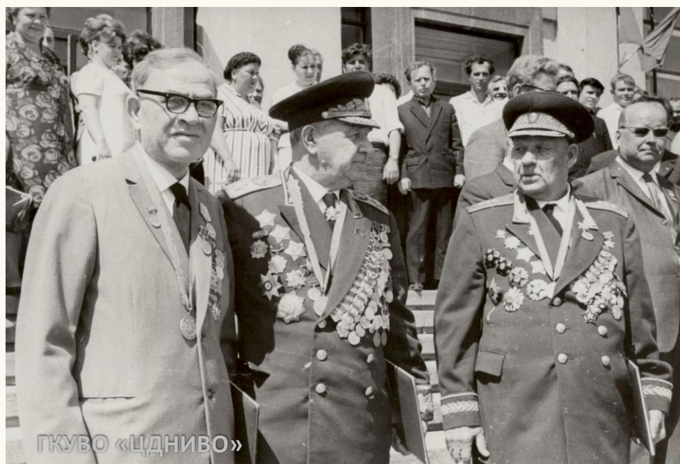
Почетные граждане города-героя Волгограда на праздновании 30-летия Победы в Великой Отечественной войне. Слева направо: первый секретарь Сталинградского обкома ВКП(б) в дни Сталинградской битвы А.С. Чуянов; командующий 62-й армией, Герой Советского Союза В.И. Чуйков; командующий 64-й армией, Герой Советского Союза М.С. Шумилов. Волгоград, 1975 г.