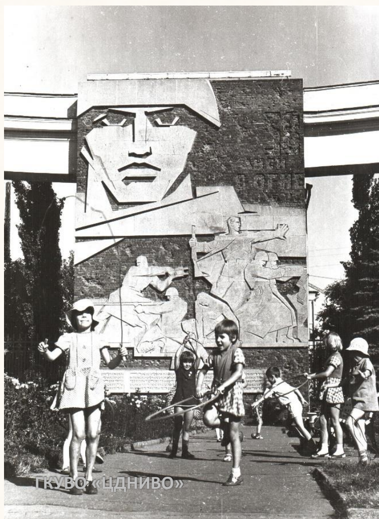
Дом Павлова. Из фотовыставки «Волгоград - продолжение подвига!». [1970-е гг.] // ЦДНИВО. Ф. 13226. Оп. 1. Д. 2086. Л. 137.