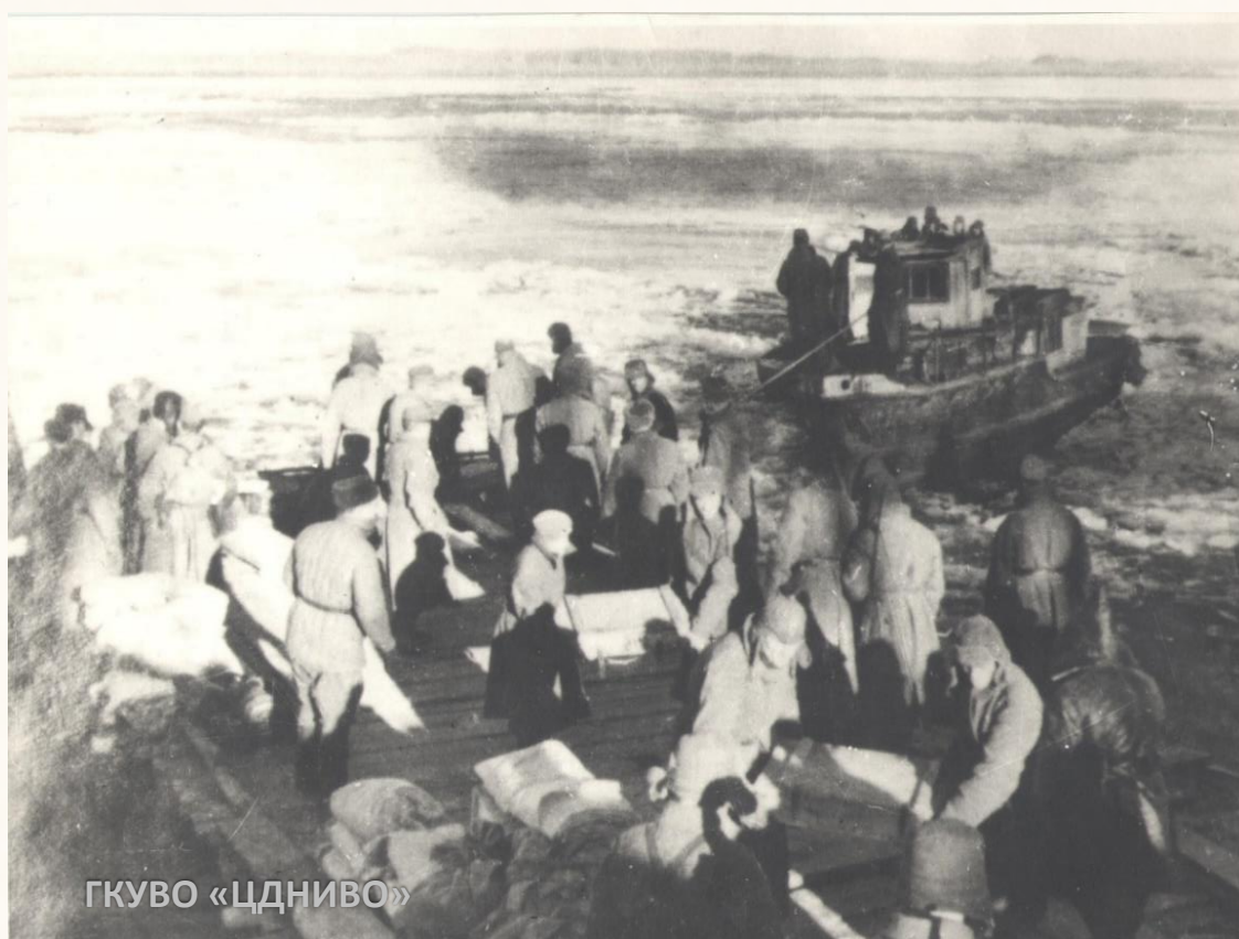
Перевозка на катере боеприпасов с левого берега Волги, г. Сталинград. Осень 1942 г. // ЦДНИВО. Ф. 13226. Оп. 1. Д. 1503. Л. 2.