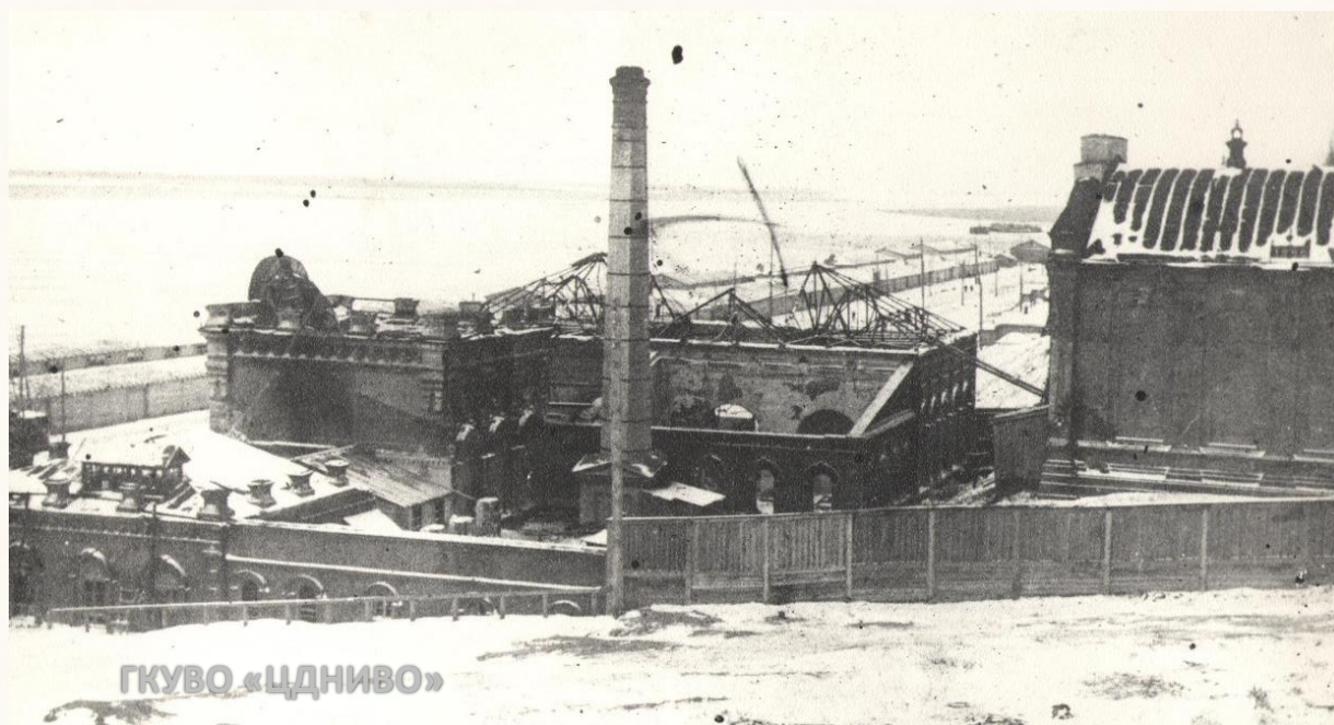
Разрушенная водоканка, г. Сталинград. 1942 г.