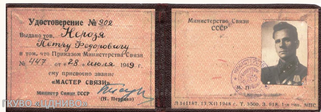
Удостоверение мастера связи Нерози Петра Федоровича. 28 июля 1949 г. // ЦДНИВО. Ф. 149. Оп. 3. Д. 826.