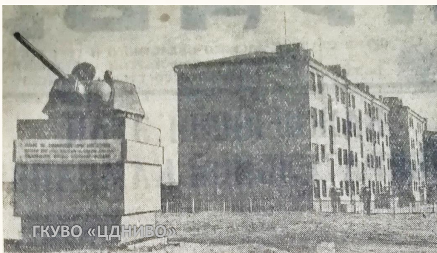
Дом солдатской славы (Дом Павлова) в восстановленном виде. 58 дней и ночей этот дом защищал гарнизон под командованием лейтенанта Ивана Филипповича Афанасьева.