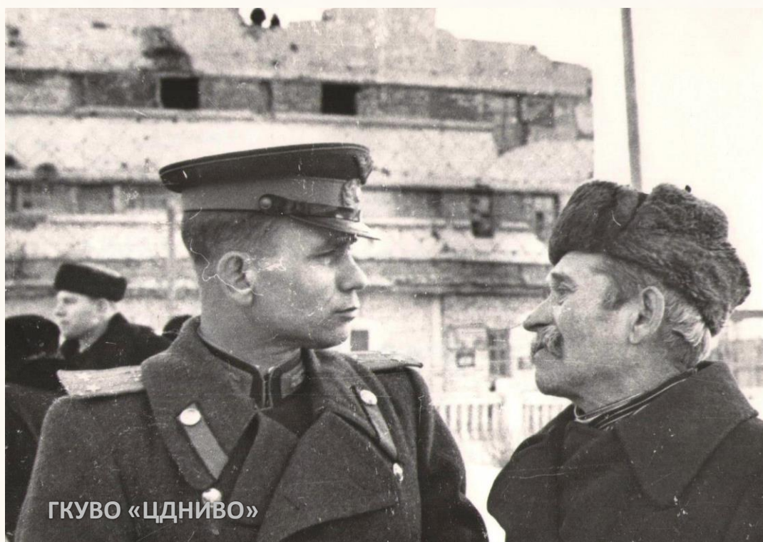
Летчик, дважды Герой Советского Союза Василий Сергеевич Ефремов с отцом. Сталинград, 1944 г.