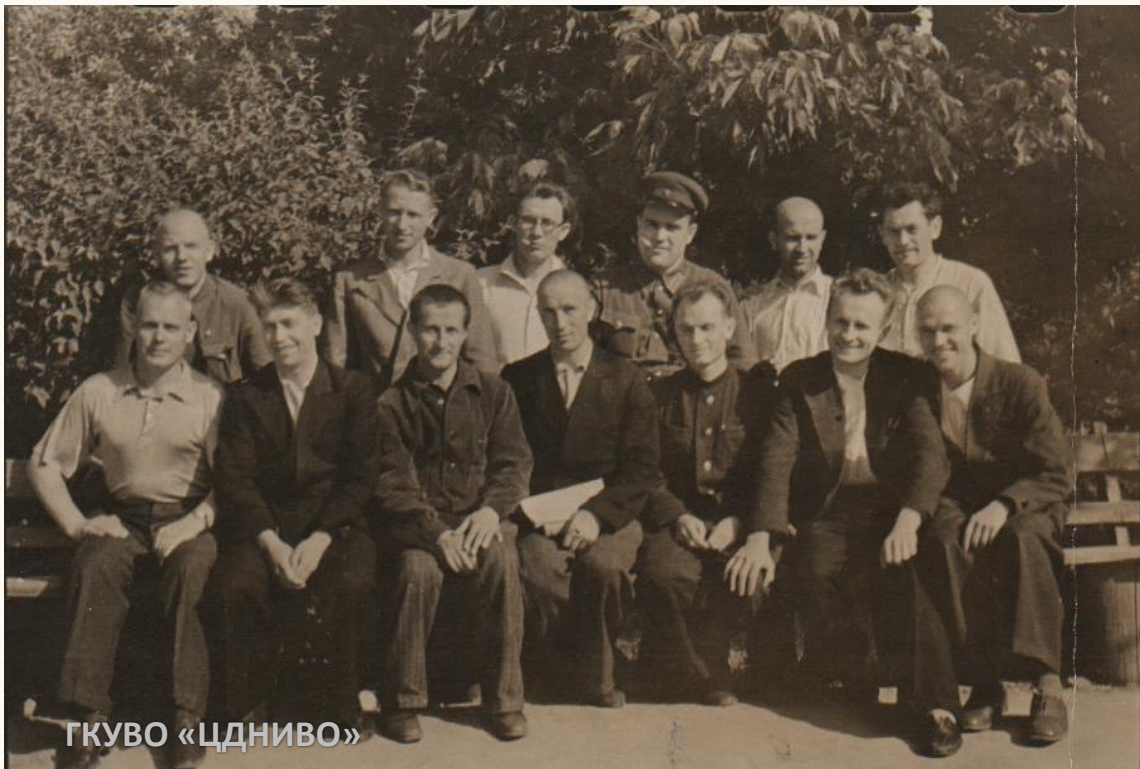
Проводы сотрудников редакции «Молодой ленинец» на фронт в первые дни войны. г. Сталинград, июнь 1941 г.