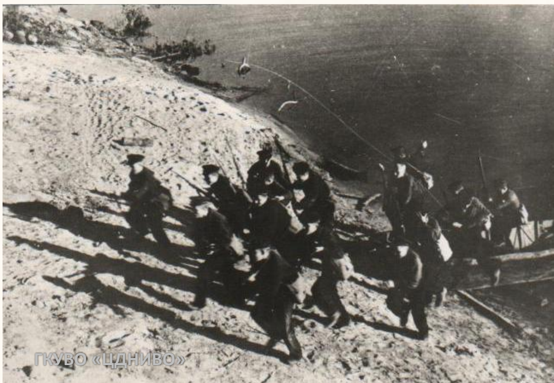
Высадка десанта краснофлотцев на берег Волги. 1942 г. //ЦДНИВО. Ф. 13226. Оп. 1. Д. 1703. Л. 2.