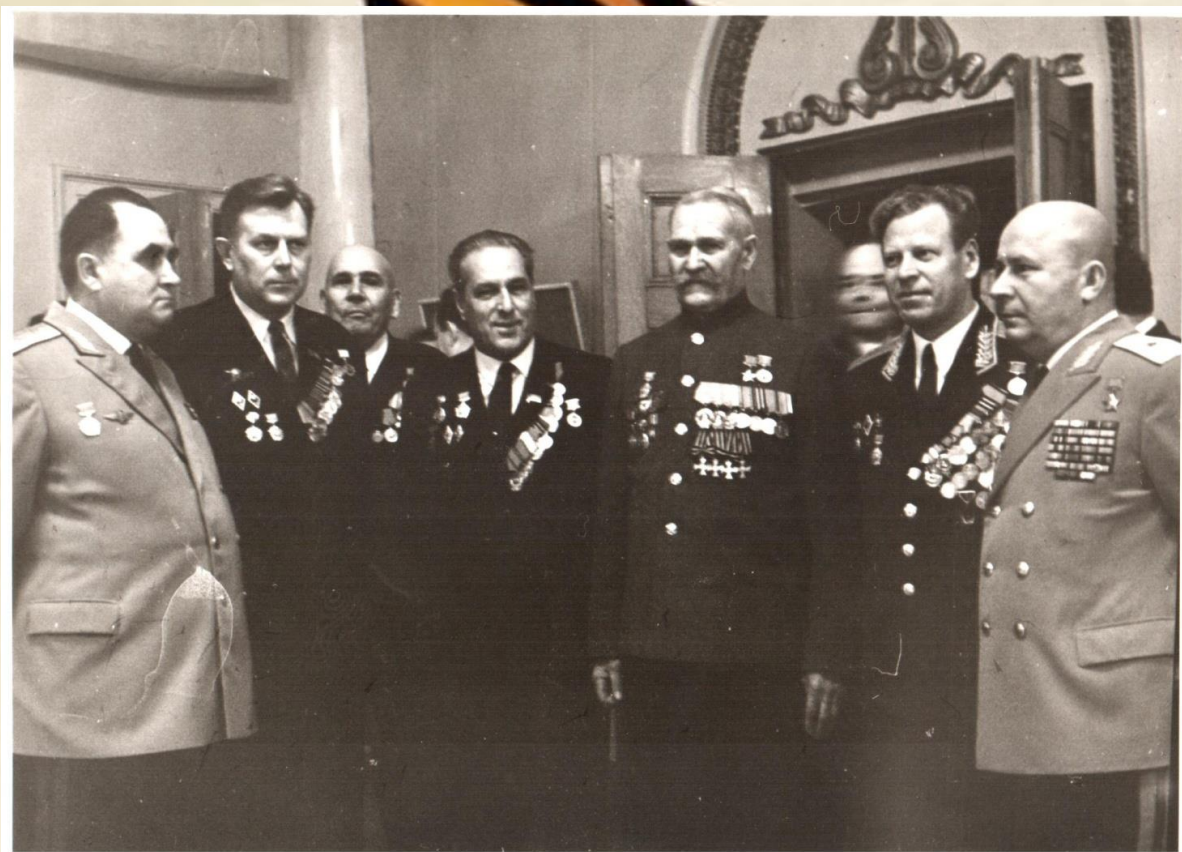
Герой Советского Союза Недорубов К.И. среди участников праздничного мероприятия, посвященного 50-летию советской власти. 1967 г. / ЦДНИВО. Ф. 13226. Оп. 1. Д. 2368.