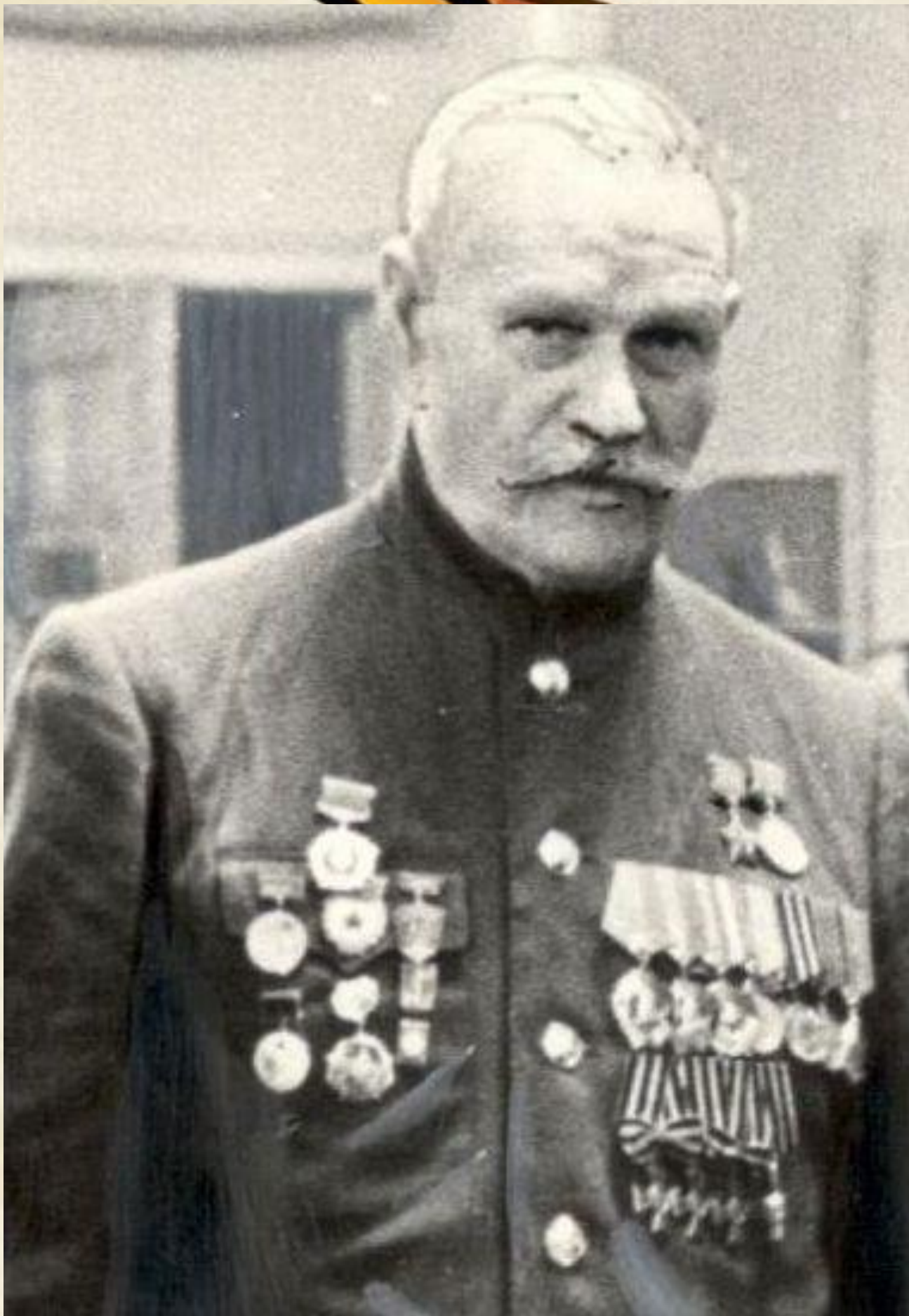
Герой Советского Союза Недорубов Константин Иосифович. Б\д. Фрагмент фото.